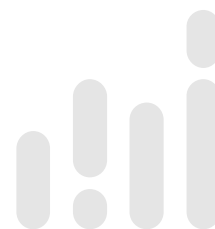
Rysunek 2. Stopa bezrobocia w powiecie miechowskim, województwie małopolskim i Polsce w latach 2013-2018