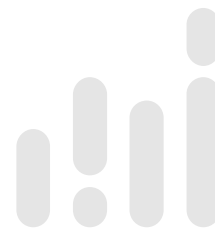
Tabela 7. Grupy zawodów, dla których wskaźnik płynności bezrobotnych jest najwyższy w 2018 roku